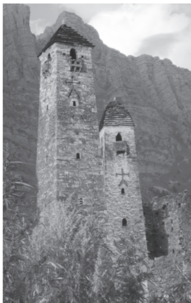
Илл. 2. Башни селения Ньюй, Ассиновское ущелье, Ингушетия (Белецкий 2011: 27).

«crúci» (крест). Вооружившись этим словом, он изобразил убийство на кресте («an guse aslagan»; 4462), упомянув холодную сталь гвоздей, вбитую молотом сквозь руки и ноги, и кровь, льющуюся на землю (5535–5540). Однако за этим последовала неожиданная смена декораций. Вероятно, для большей наглядности поэт расположил на Голгофе инструмент казни, более понятный саксам, – виселицу (galgo). В итоге этой смены декораций сам момент окончания земной жизни Иисуса обрёл неожиданную двусмысленность. Наиболее распространённый вариант перевода соответствующих строк «Спасителя» небесспорен и оставляет возможности для иного прочтения. Однако обычно переводчики этого текста (Дж. Кейси, Р. Мерфи и проч.) сходятся в том, что в час смерти на шею Иисуса была накинута петля» (Домский 2016: 42-43). Приведенная цитата ясно указывает на адаптацию евангельского сюжета местной традицией, вписывающей его в привычный ей историко-культурный контекст, а также на то, насколько далеко она может зайти. Этим обстоятельством могут объясняться и изображения голгофы, встречающиеся на боевых башнях Северного Кавказа (см., об этом подробнее, в том числе и дискуссию, Белецкий 2011: 26-29).