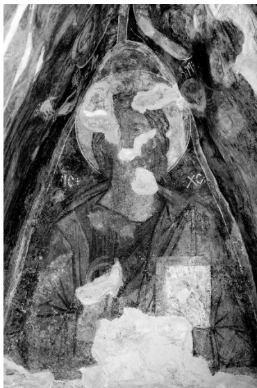
Илл. 1. Христос Пантократор (Вседержитель). Фрески средневекового нузальского храма, Северная Осетия.

Вот какое объяснение сложившейся противоречивой по своему характеру ситуации он предлагает: «Сложнейшее богословие образа Иисуса Христа, отсутствие подходящих по смыслу альтернатив даже в развитых традиционных дохристианских мировоззренческих представлениях алан-осетин привели к закономерной минимализации Его присутствия. Обратим внимание, что народное сознание не пошло по простому пути изменения, а значит, профанации образа Спасителя. Напротив, максимально возможное в сложившихся исторических условиях сохранение структурной части аланского церковного календаря произошло через его включение в народный календарь» (Мамиев 2016: 100-101). Приведенное объяснение все же не может считаться окончательным, поскольку основано лишь на одном – пусть чрезвычайно важном и информативном – историческом источнике, а именно, традиционном календаре. Все же помимо календаря в нашем распоряжении есть также и другие источники, позволяющие взглянуть на проблему в новом свете и выдвинуть иные версии сложившейся ситуации.